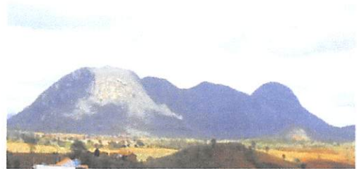
SERRA DE CATURITÉ

A Serra de Caturité fica no Povoado de Pedra D'água, município de Caturité, com aproximadamente 900 metros de altitude o Pico do Caturité é o 3º mais alto do estado da Paraíba, ele abrange os vilarejos de Serraria e Pedra D'água, mas o melhor acesso a subida fica por Pedra D'água, que tem sido muito visitado, por esportistas, arqueólogos, e os que só preferem a trilha em buscar de admirar as belas paisagens. Fica aqui a sugestão de passeio em um fim de semana ou feriado.